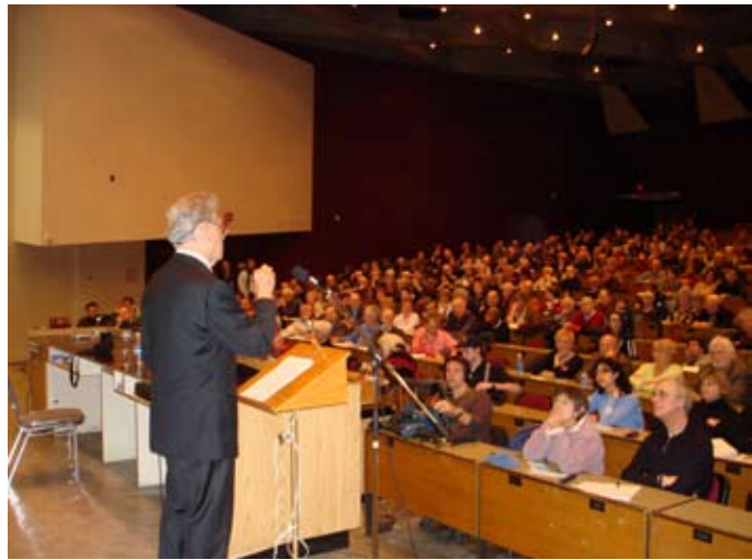
Hans Küng, invité des Belles Soirées et Matinées